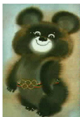
талисман (Медведь Миша)